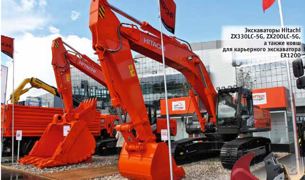
Экскаваторы Hitachi ZX330LC-5G, ZX200LC-5G, а также ковш для карьерного экскаватора EX1200

около 22 т. Бульдозер оснащен двигателем Cummins мощностью 142 кВт и эксклюзивным двух-скоростным модульным механизмом поворота.