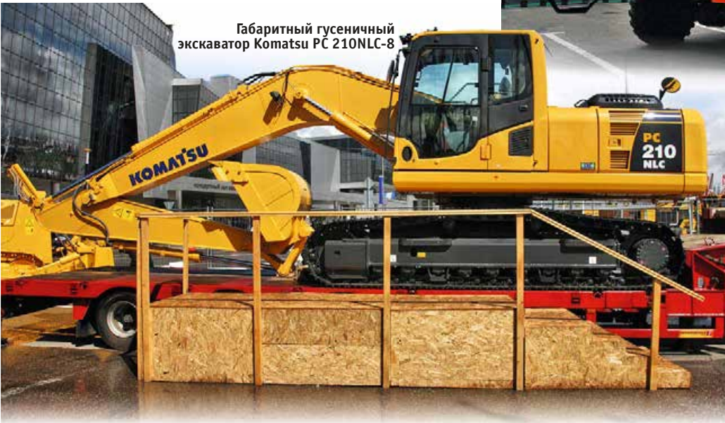
Габаритный гусеничный экскаватор Komatsu PC 210NLC-8

водство работает три года и дает возможность разнообразить комплектацию, адаптировать ее под требования заказчика. Также челнинская база обеспечивает сервисное обслуживание и снабжение запасными частями.