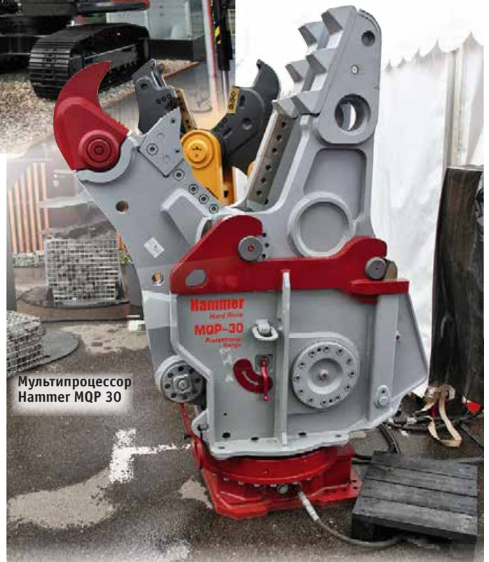
Мультипроцессор Hammer MQP 30

вал пневмокоток GRW 10. С полным балластом масса катка достигает 20 т. Асфальтоукладчики были представлены всего двумя моделями: SUPER 1300-3 и 1900-3, обеспечивающими ширину укладки 5 и 11 м. Техника под маркой Wirtgen включала холодный ресайклер WR 240, малую фрезу W 50 и средние фрезы: колесную W 100 и гусеничную W 130 CF. Дробильно-сортировочное оборудование Keemann представляла мобильная сортировочная установка (грохот) модели MS 952 EVO производительностью 500 т/ч и мас-