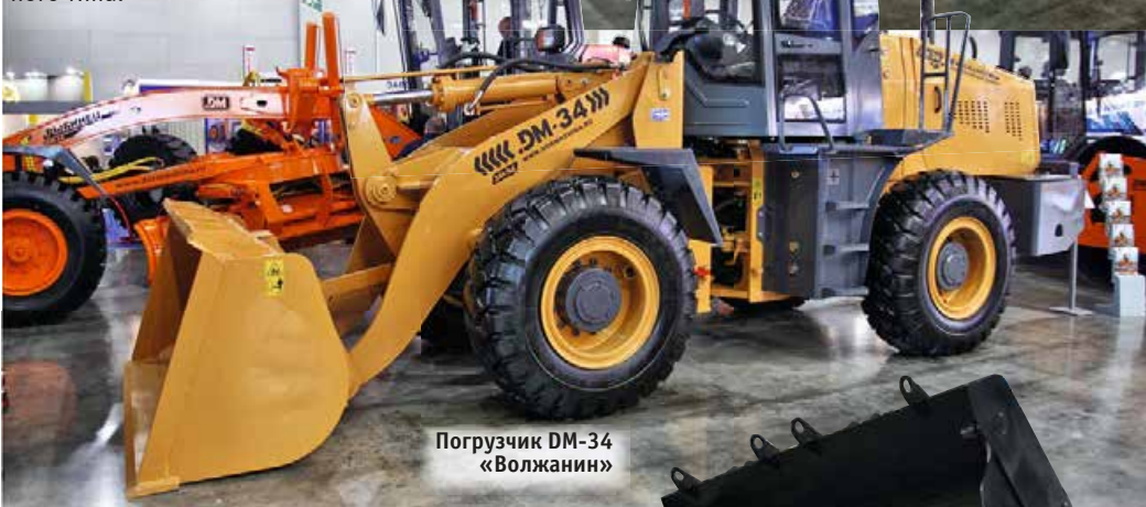
Погрузчик DM-34 «Волжанин»

Серия F включает модели LG 953F грузоподъемностью (г/п) 5 т, LG 956FH г/п 5,4 т и LG 968F г/п 6 т. Погрузчики оснащены двигателями Weichai China Phase II объемом 9,7 л и мощностью 162 и 178 кВт. Также представили самый крупный в линейке погрузчик LG 978 г/п 7 т, выполненный в прежней концепции. Погрузчик также разработан для российских карьеров и полностью построен на импортной компонентной базе, при этом цена весьма конкурентна.