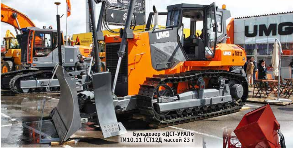
Бульдозер «ДСТ-УРАЛ» TM10.11 GST12D массой 23 т

Компания Wirtgen традиционно показала серийную продукцию: катки Hamt, асфальтоукладчики Vögele, фрезы Wirtgen, дробильно-сортиро-