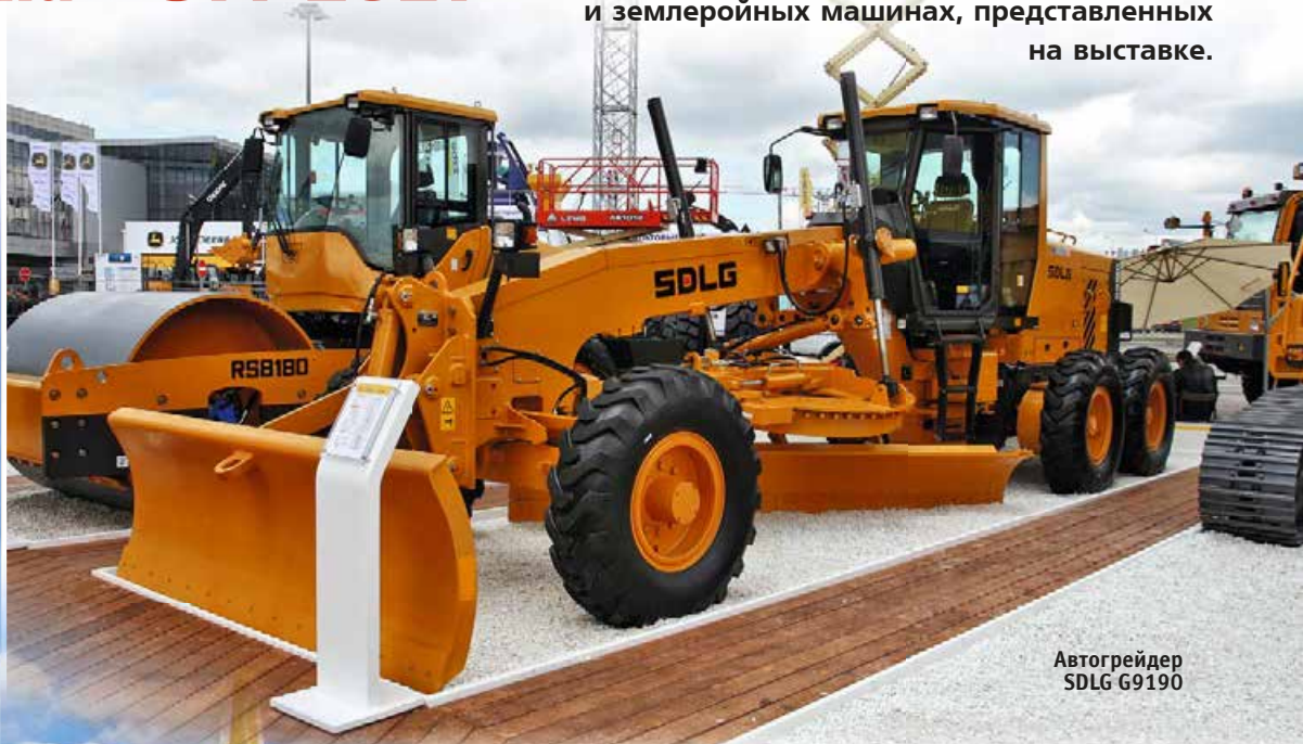
Автогрейдер SDLG G9190

Продолжаем обзор «СТТ-2017», и в этой статье поговорим о дорожно-строительных и землеройных машинах, представленных на выставке.