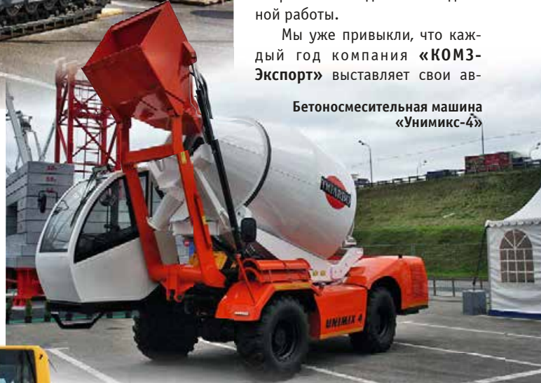
Бетономесительная машина «Унимикс-4»

тобетономесители с красочным логотипом TIGARBO, а иногда и автобетононасосы. Но в этом году бетонную тематику представляла только универсальная бетономесительная машина «Унимикс-4». Машина представляет собой самоходное шасси с барабаном вместимостью 4 м 3 , установленным на опорно-поворотном устройстве. Машина предназначена для приготовления раствора непосредственно на строительной площадке и подачи его к месту укладки.