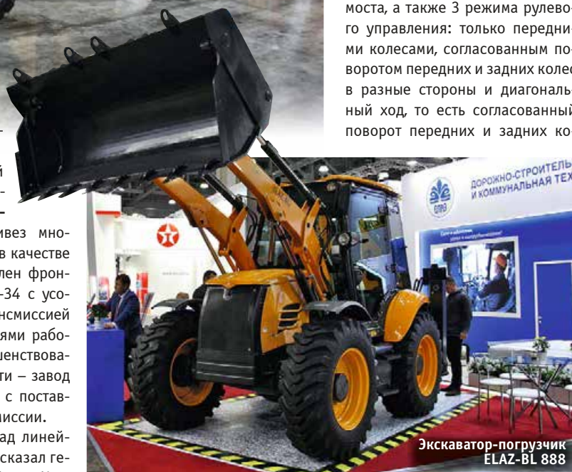
Экскаватор-погрузчик ELAZ-BL 888

ков ELAZ BL и представило новую топовую модель с равновеликими колесами ELAZ-BL 888. Машина оснащена двигателем Perkins мощностью 74,5 кВт, полуавтоматической КП Carraro и ведущими и управляемыми мостами Carraro. Полный привод включается принудительно, предусмотрена блокировка дифференциала заднего моста, а также 3 режима рулевого управления: только передними колесами, согласованным поворотом передних и задних колес в разные стороны и диагональный ход, то есть согласованный поворот передних и задних ко-