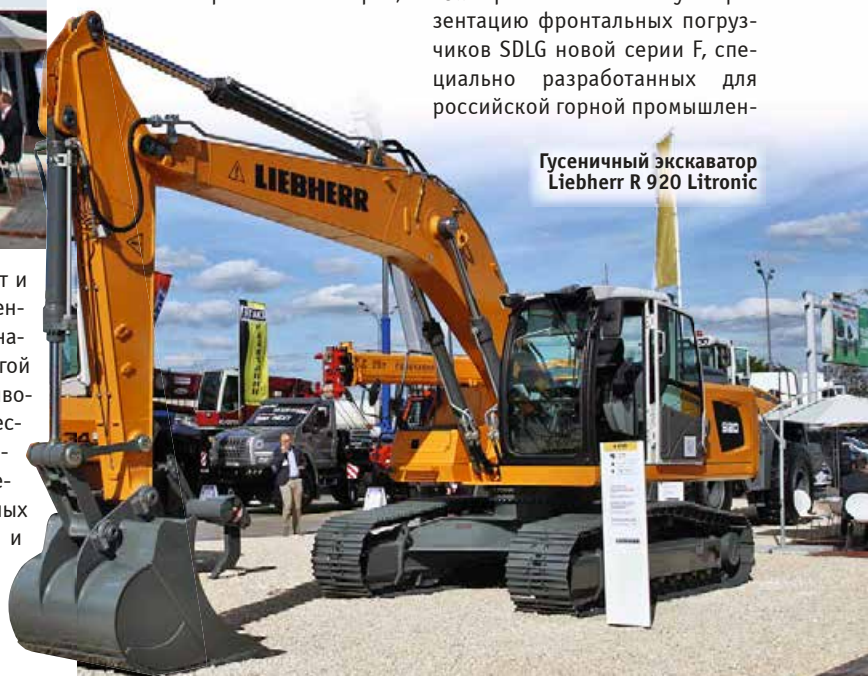
Гусеничный экскаватор Liebherr R 920 Litronic

Компания «Русбизнесавто» провела масштабную презентацию фронтальных погрузчиков SDLG новой серии F, специально разработанных для российской горной промышлен-