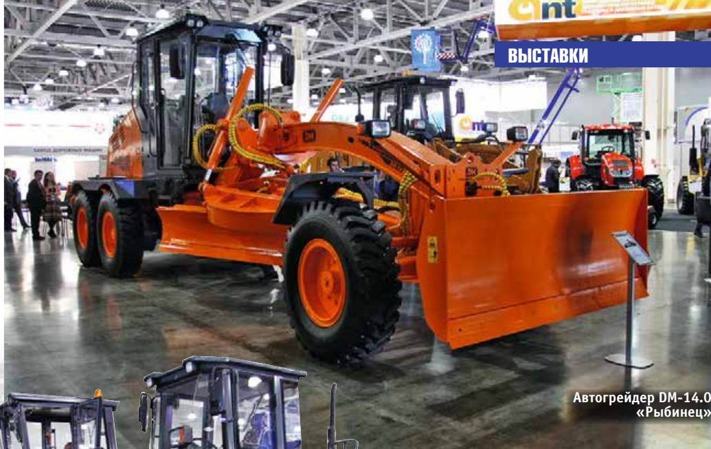
Автогрейдер DM-14.0 «Рыбинец»

ности: трехступенчатые фильтры, двигатели повышенной мощности, усиленные мосты, новые надежные коробки передач. Полностью переработаны полурамы, которые повторяют конструкции погрузчиков Volvo, увеличена колесная база. Полностью переделано крепление мостов, шарнирное сочленение. Полностью переделана кабина, прямые стекла заменены панорамными, на 13% увеличено полезное пространство, улучшена шумо- и виброизоляция. Обновлены двигатели, использованы фильтры циклонного типа.