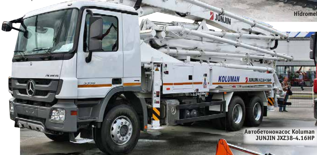
Автобетононасос Koluman JUNJIN JXZ38-4.16HP

Экспозиция компании также включала в себя телескопи-