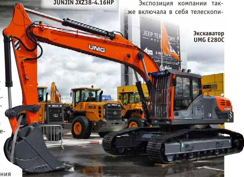
Экскаватор UMG E280C

В этом году компания Hidromek, точнее, краснодарское представительство – компания «Хидромек Рус», выставила технику, поставляемую на российский рынок достаточно давно. На стенде представили 22-тонный колесный экскаватор HMK 200W и 22-тонный гусеничный HMK 220LC. С экскаваторами соседствовали экскаваторы-погрузчики HMK 102B Alpha и HMK 102S Alpha. Первый – с разновеликими колесами, второй – с одинаковыми. На обе машины установлен наддувный двигатель Perkins мощ-