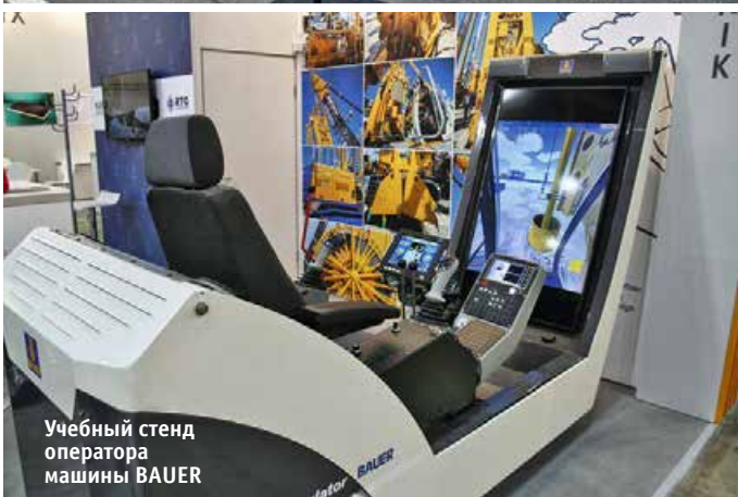
Учебный стенд оператора машины BAUER

вочное оборудование Kleemann. Так, обширное семейство катков Hamm было представлено тротуарными гладковальцовыми моделями HD 12 VT и HD 10 VV (с двумя вибробандажами) массой 3,2 и 2,4 т. Тяжелые асфальтовые катки представлены моделями HD+ 110 VO и HD+ 140 VO массой 10,3 и 13,3 т. Аббревиатура VO означает, что каток с вибрацией и осцилляцией. Осцилляцию применяют там, где вибрация недопустима, например, на мостах.